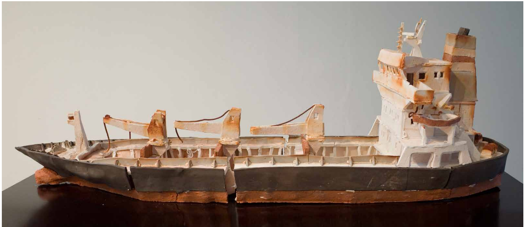
Stückgutfrachter 120 x 40 x 37 cm Ceramic Sculptures 2014