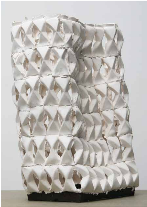
One-component piled until collapse 5 2014 Ceramic Sculptures 25 x 16 x 45 cm