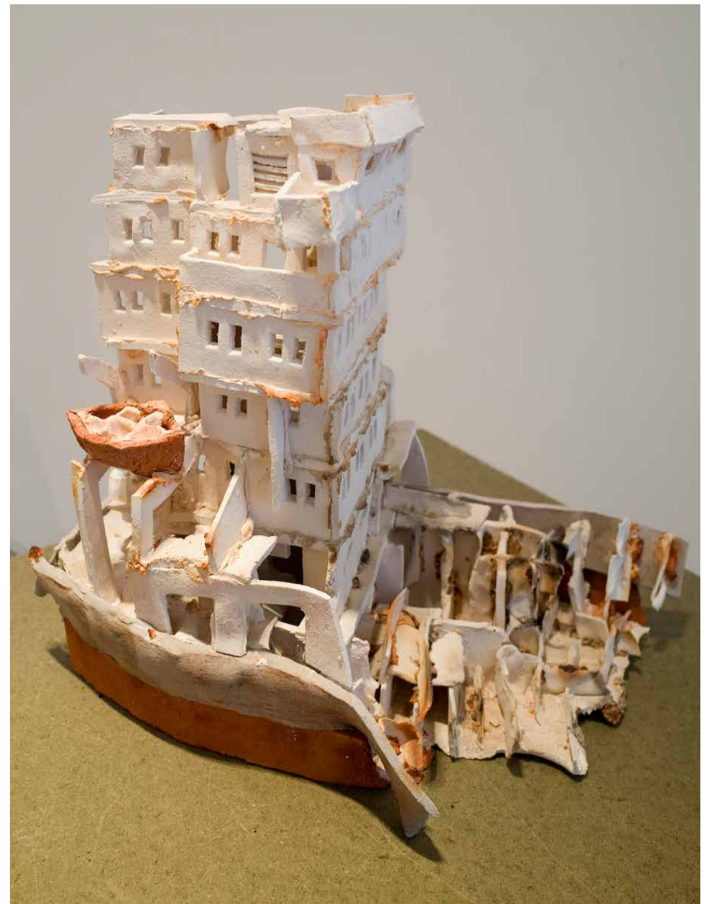
Schiffbruch 55 x 43 x 32 cm Ceramic Sculptures 2014