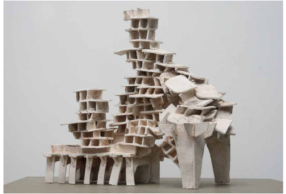
Kowloon, 2014 Ceramic Sculptures 42 x 50 x 20 cm