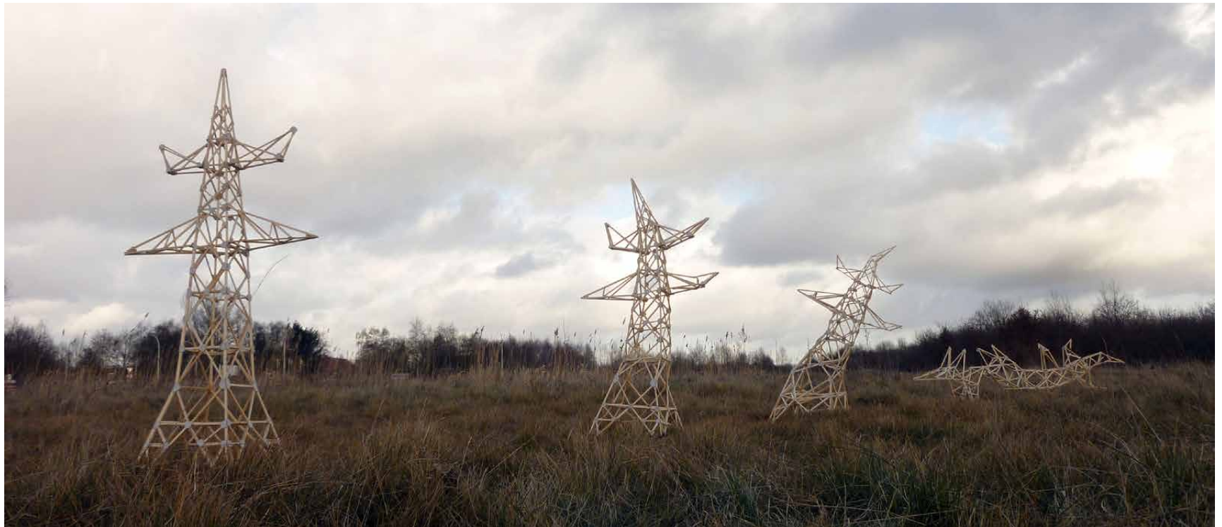
Netzstörung 2015 schetsontwerp landschapskunstwerk voor "Kunst Inags de Linie" Stadskanaal CBK Groningen, CBK Drenthe en Stichting 250 / 400 karton en hout Prijs op navraag