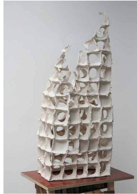
One-component piled until collapse 6 2014 Ceramic Sculptures 15 x 25 x 64 cm