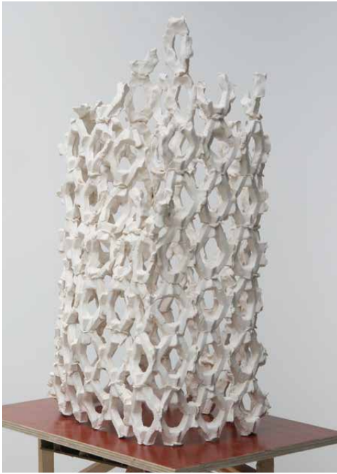
One-component piled until collapse 2 2014 Ceramic Sculptures 20 x 30 x 57 cm