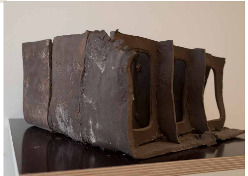
Rumpfstück 35 x 17 x 36 cm Ceramic Sculptures 2014